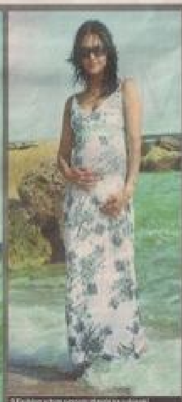
4. Długa w tym sezonie rzuca się od razu