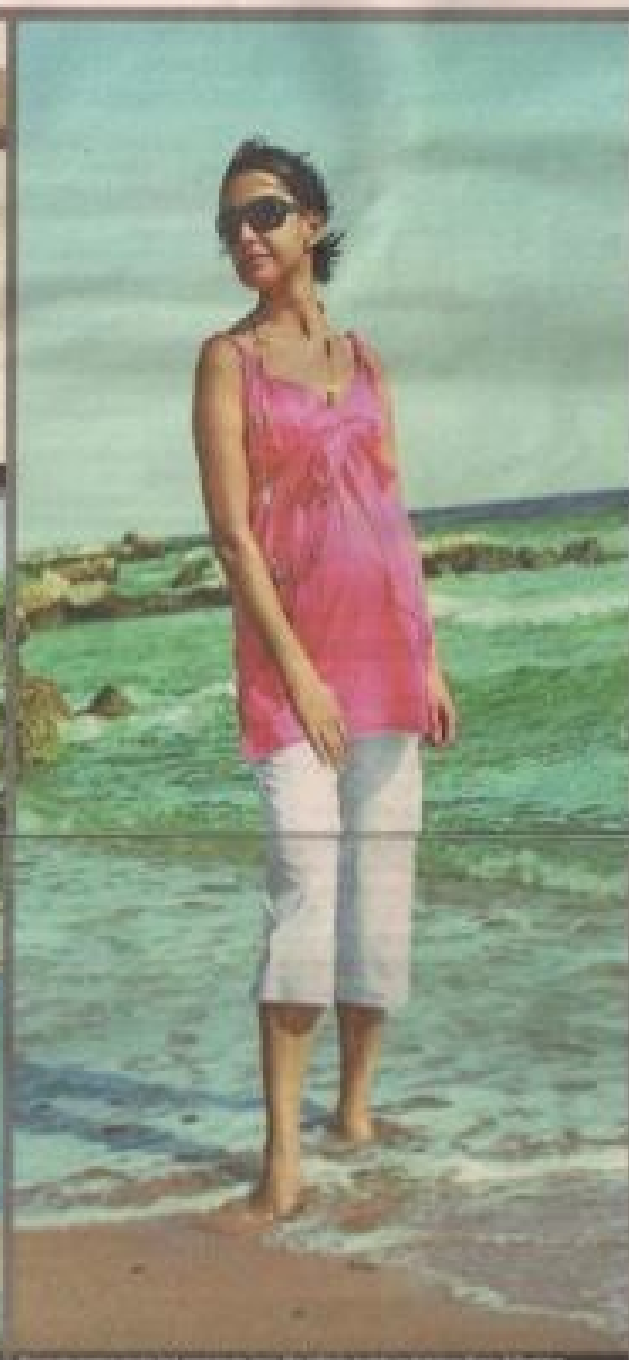
3. Kolorowa bluzka i jeansy to znakomity duet