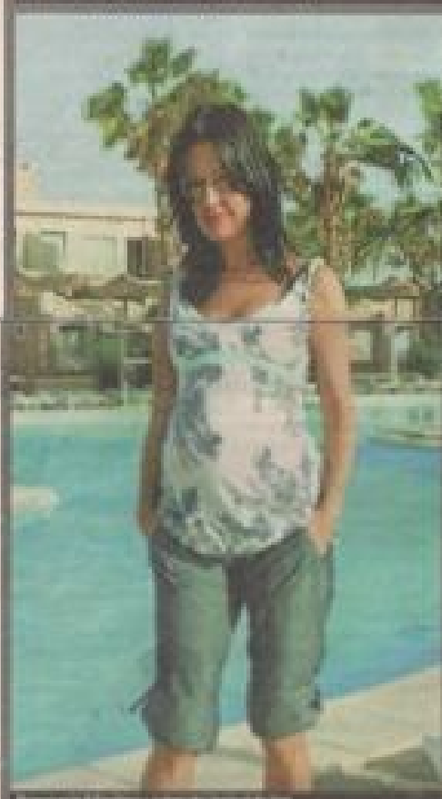
2. Kolorowa bluzka i jeansy to znakomity duet