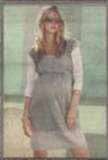
5. Długa w tym sezonie rzuca się od razu